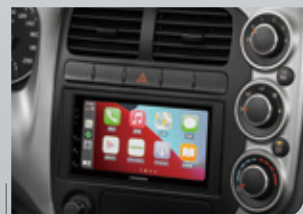
7吋多媒體影音系統