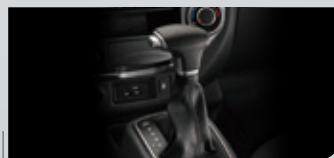
全新5速手自排變速箱