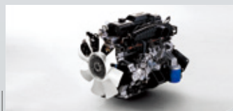
2.5升新世代CRDi柴油渦輪引擎