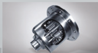
機械式後軸差速器鎖定(4WD專屬)