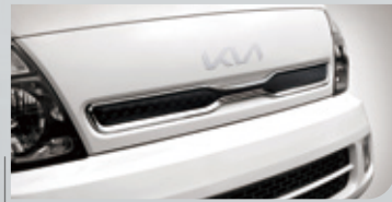
虎鼻造型水箱護罩