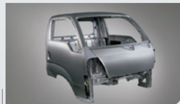
籠型結構安全車頭 車頂+車側+車底強化鋼樑