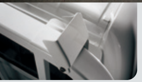
車頂架可收式貨物固定夾