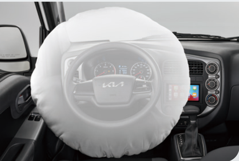
駕駛座SRS輔助氣囊 [同級唯一]