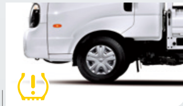
TPMS胎壓偵測系統(4WD車型)