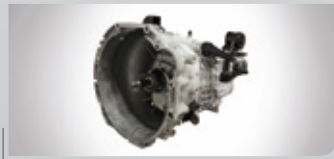
全新6速手排變速箱