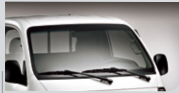
間歇可微調式雨刷