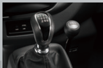
分時四輪傳動系統 (附2H/4H/4L切換)