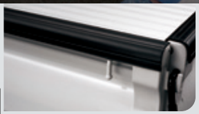
貨斗護條(雙廂專屬)