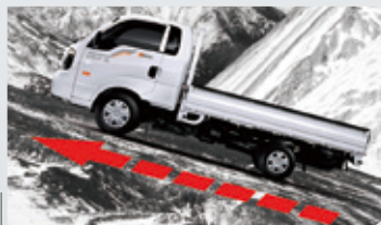
HAC上坡起步輔助系統