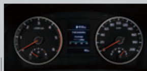
3.5吋多功能行車電腦