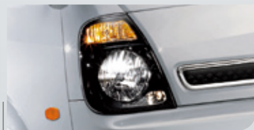
燻黑動感晶鑽型頭燈